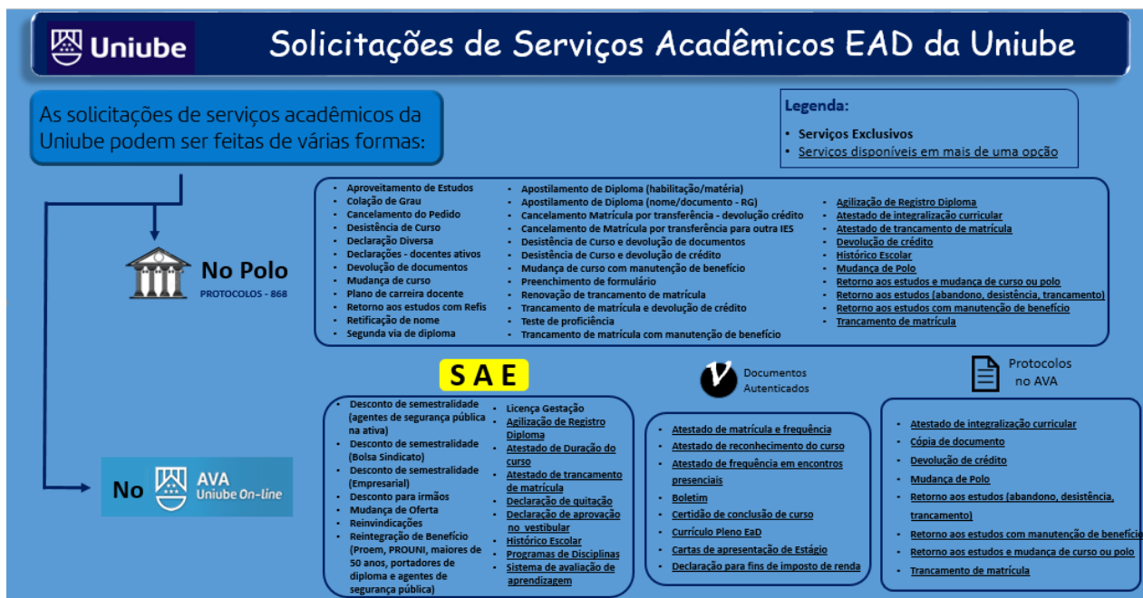
Figura 2. Infográfico de Processos e Solicitações de Serviços Acadêmicos EAD Uniube.

Os processos internos e fluxos se tornaram mais claros, foram redefinidos e muitos criados, fazendo fluir os pedidos e solicitações. Nossa meta de atendimento hoje é de 24 horas, conforme vemos na figura abaixo: